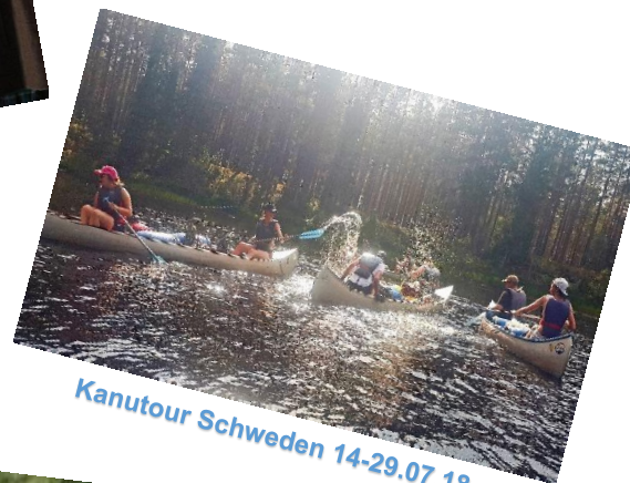
Kanutour Schweden 14-29.07.18