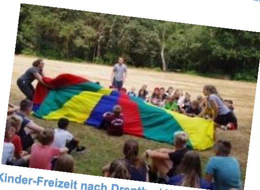
Kinder-Freizeit nach Drenthe / NL 3.-24.08.18